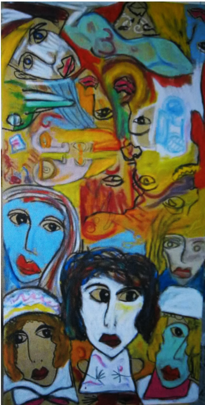
Œuvre de Andréa Siri en collaboration avec Colin Zmirou-Macbride, 120x60, acrylique, MDF, 2012