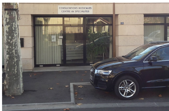
Consultations avancées — CMP Saint Auban

Nous consultons régulièrement la messagerie qui vous permet de nous communiquer vos coordonnées et le motif de votre appel afin que l'on puisse vous recontacter.